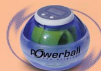
MAX blue light + counter