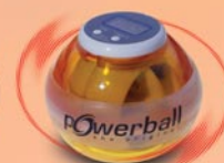
MAX red light + counter