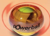
Lightning red light