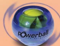
Lightning blue light